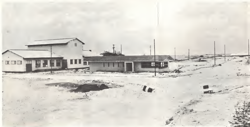
Zona liber den full swing, na encua